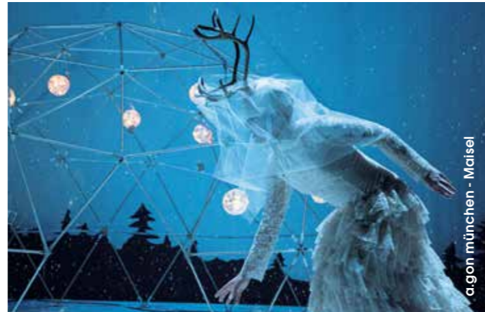
a.gon münchen - Maisel

Begleiten Sie unsere Darstellerinnen auf einer magischen, bisweilen verrückten Reise und erleben Sie dabei, wie Gerdas Liebe zu Kay ein jedes Hindernis zu überwinden vermag.