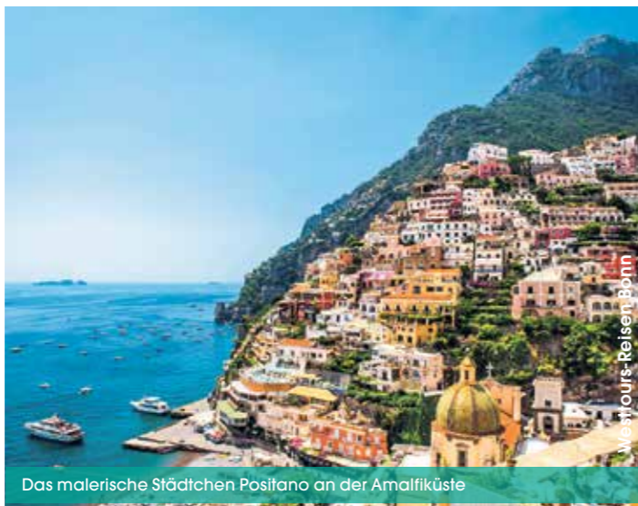
Das malerische Städtchen Positano an der Amalfiküste

Stadt am 4.Tag ist eine ausführliche Besichtigung des vom Ordensvater Benedikt von Nursia gegründeten Klosters Montecassino mit Gottesdienstfeier vorgesehen. Das Kloster wurde im 2. Weltkrieg während einer monatelangen blutigen Schlacht der deutschen Wehrmacht gegen die Alliierten mit vielen Gefallenen auf beiden Seiten im Februar 1944 durch ein Luftbombardement völlig zerstört und nach dem Krieg wiederaufgebaut.