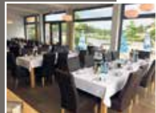
Im Frühstücksraum Hotel bieten wir Platz bis zu 60 Personen, Essen in Buffetform

So traurig der Abschied von einem geliebten Menschen auch ist, so wichtig ist eine würdevolle Trauerfeier.