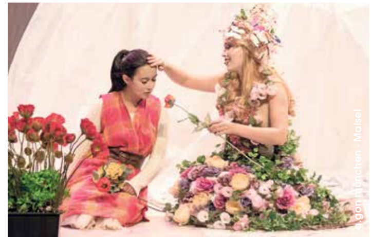
a.gon münchen - Maisel