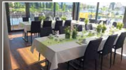
Im Panoramasaal bis zu 120 Personen

Stilvolle Atmosphäre, auf Wunsch mit Stoffischdecken, Kerzen und saisonaler Tischdekoration.