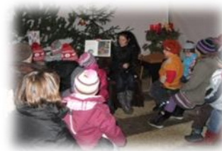
Betthupferlgeschichten beim Christbaum