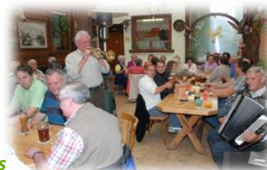
Musik im Wirtshaus