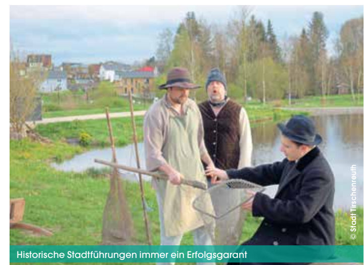
Historische Stadtführungen immer ein Erfolgsgarant

Weiterhin startet im Mai die Wiederholung der fünften Staffel der beliebten historischen Stadtführungen in Kooperation mit dem Modernen Theater Tirschenreuth. Die Maitermine sind schon ausverkauft, Restkarten für Juni oder