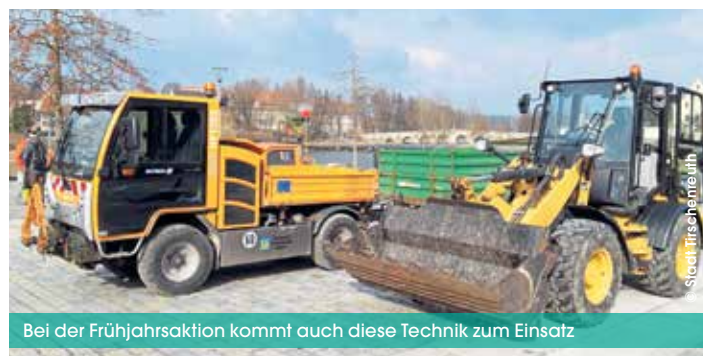
Bei der Frühjahrsaktion kommt auch diese Technik zum Einsatz

sowie des Förderverein-Parkteams sind alle Naturliebhaber eingeladen, bei der Verschönerung des Geländes mitzuwirken. Wer einen Rechen bei der Hand hat, sollte diesen bitte mitbringen. Treffpunkt ist am Samstag, 16. März 2024 um 13.00 Uhr am Hotel „Seenario“. Die Aktion wird höchstens zwei Stunden dauern, anschließend sind alle Helfer zu einer Brotzeit eingeladen. (Mirko Streich, Förderverein Fischhofpark)