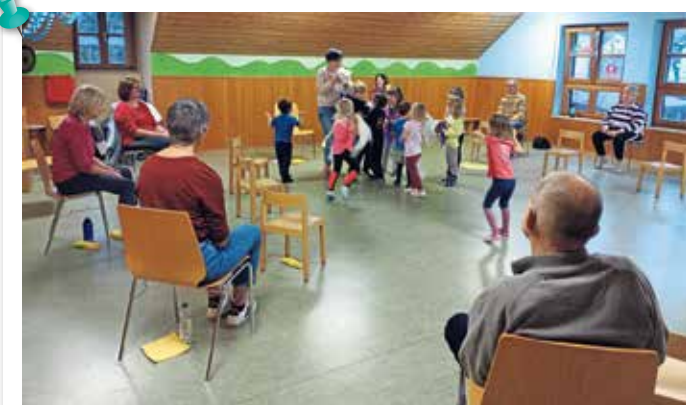
Großeltern-Kind-Turnstunde Im Dezember gab es an einem Freitagnachmittag im Kinderhaus zum ersten Mal eine Großeltern-Kind-Turnstunde. Der Andrang war so groß, dass es im Frühling eine zweite Auflage geben wird. Die 15 Großeltern hatten zusammen mit ihren Enkelkindern viel Spaß bei Bewegung und Musik im Turnraum des Kinderhauses.

Alle Bilder und Texte: © Monika Zeidler, Kath. Kinderhaus, www.kath-kiga-tir.de