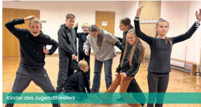
Kinder des Jugendtheaters