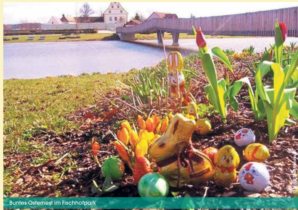
Buntes Osternest im Fischhofpark

dieben“, die schon vorher eifrig unterwegs sind, bittet der Förderverein darum, nur Kinder bis 12 Jahre suchen zu lassen. (Mirko Streich, Förderverein Fischhofpark)