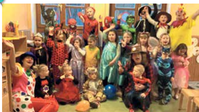
Fasching im Kinderhaus Am Donnerstag, 08.02.2024 war großer Kinderhausfasching im Kath. Kinderhaus „Unsere Liebe Frau“. Die Kinder kamen maskiert, es gab ein leckeres Essen und bei Spiel, Tanz und Musik wurde so richtig Fasching gefeiert. Deshalb gibt es alle Jahre am Tag darauf den traditionellen Pyjamatag, damit sich alle vom Feiern erholen können.