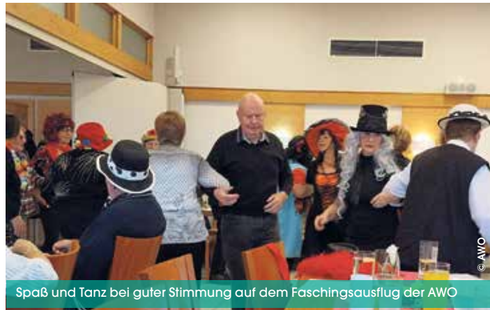
Spaß und Tanz bei guter Stimmung auf dem Faschingsausflug der AWO