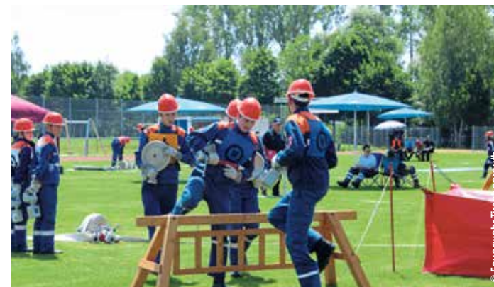
Neben dem Staffellauf ist auch ein Löschaufbau mit mehreren Hindernissen, wie hier im Bild zu sehen, möglichst fehlerfrei zu absolvieren

Bei diesem Wettbewerb ist sowohl ein Staffellauf mit mehreren Einzelübungen als auch ein Löschaufbau mit mehreren Hindernissen möglichst schnell und vor allem fehlerfrei zu absolvieren. Nach der Anreise der rund 30 Wettkampfgruppen aus ganz Bayern, veranstaltet die Feuerwehr Tirschenreuth am Donnerstag einen von Live-Musik umrahmten Eröffnungsabend beim Gerätehaus an der Mitterteicher Straße. Nach Einbruch der Dunkelheit wird