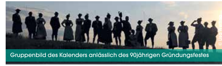
Gruppenbild des Kalenders anlässlich des 90jährigen Gründungsfestes

Der Trachten- und Heimatverein D'Werdenfeler Stamm Tirschenreuth e.V. wurde im August 1924 gegründet, somit dürfen wir in diesem Jahr unser 100-jähriges Gründungsfest feiern. Der Trachtenverein hat für sein Jubiläum diverse Veranstaltungen für seine Mitglieder und Interessierte geplant. Wie zum Beispiel: Das Maibaumaufstellen am 30.04. September, um nur zwei Termi-