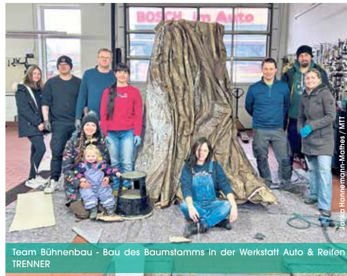
Team Bühnenbau - Bau des Baumstamms in der Werkstatt Auto & Reifen TRENNER