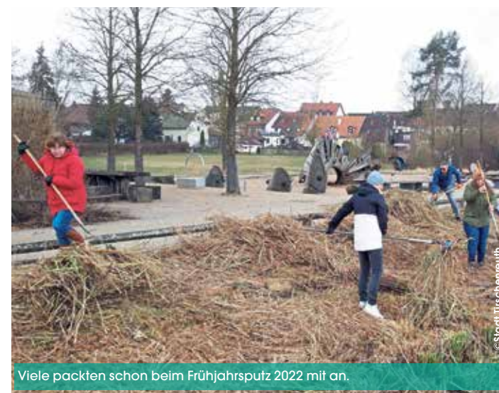
Viele packten schon beim Frühjahrspütz 2022 mit an.

Am Samstag, 15. Oktober , lädt der Förderverein Fischhofpark um 13 Uhr in den