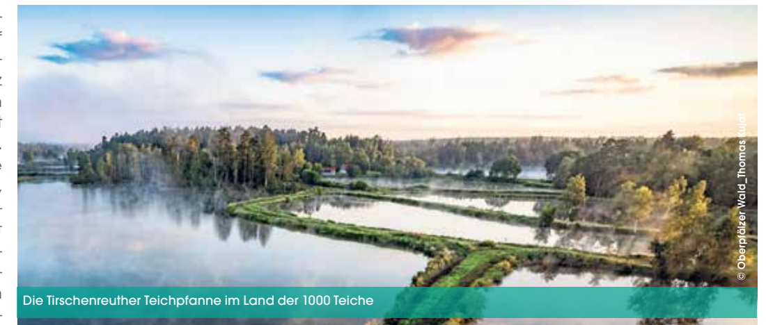
Die Tirschenreuther Teichpfanne im Land der 1000 Teiche

Die Teichwirtschaft im Landkreis Tirschenreuth blickt auf eine fast tausendjährige Tradition zurück. Schon kurz nach dem Jahr 1000 wurden die ersten Teiche im Gebiet um Tirschenreuth angelegt. Teiche prägen nicht nur die Landschaft unserer Region, sondern sorgen für Abwechslung und Geschmacksvielfalt auf dem Teller. Eine besondere Zeit, um all diesen Genüssen näher zu kommen, bieten die alljährlichen Erlebniswochen Fisch – als Auftakt und gleichzeitig einer der Höhepunkte der Karpfensaison.