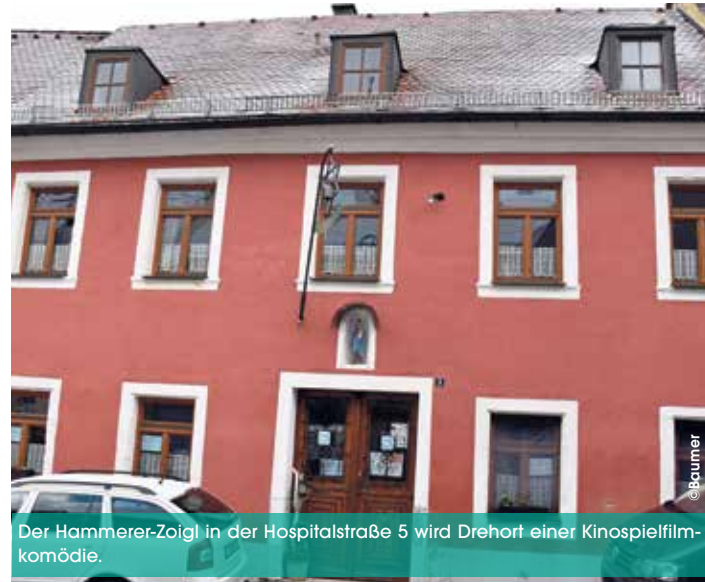
Der Hammerer-Zoigl in der Hospitalstraße 5 wird Drehort einer Kinospielefilm-Komödie.