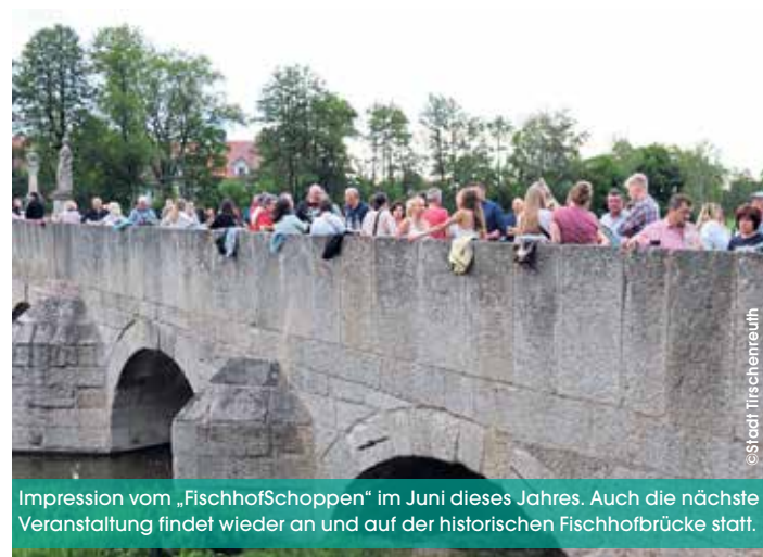
Impression vom „FischhofSchoppen“ im Juni dieses Jahres. Auch die nächste Veranstaltung findet wieder an und auf der historischen Fischhofbrücke statt.

Die vom Förderverein Fischhofpark organisierten Tirschenreuther Gartentage wurden auch heuer im Fischhofpark mit einer „FischhofSchoppen“-