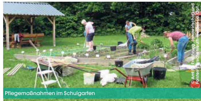
Pflegemaßnahmen im Schulgarten

In der Küchenpraxis lernen die Studierenden von Grund auf alles Wissenswerte über die Verarbeitung von Lebensmitteln zu leckeren und gesunden Speisen. Die richtige Pflege von Pflanzen oder auch was beim Anbau im eigenen Garten zu beachten ist, wird