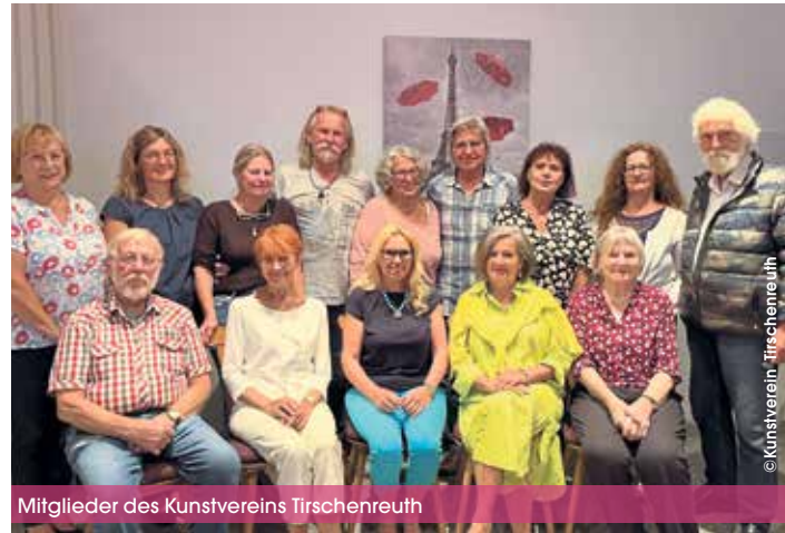
Mitglieder des Kunstvereins Tirschenreuth

Diesmal beteiligen sich die Grundschule und die Mittelschule Tirschenreuth am Austausch. Wir dürfen gespannt sein auf den kreativen Out-