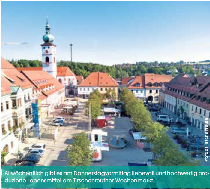
Allwöchentlich gibt es am Donnerstagvormittag liebevoll und hochwertig produzierte Lebensmittel am Tirschenreuther Wochenmarkt.