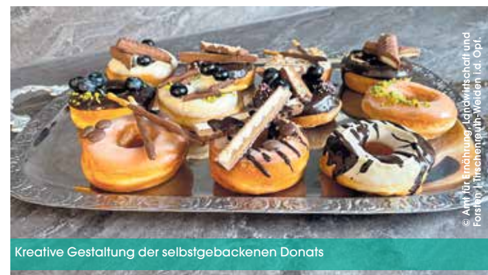
Kreative Gestaltung der selbstgebackenen Donats

INFO: An diesem Sonntag findet kein weiterer evangelischer Gottesdienst im Stiftland statt (auch nicht in Waldsassen, Mitterteich und Wiesau) (Dagmar Franz, Evang. Pfarramt Tirschenreuth)