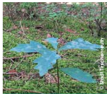
Junge Eiche. Langsam, aber sicher, wird der Stadtwald immer mehr zum Mischwald.

Viele Bäume wurden von Borkenkäfern befallen und starben an den Folgen ab. Sobald