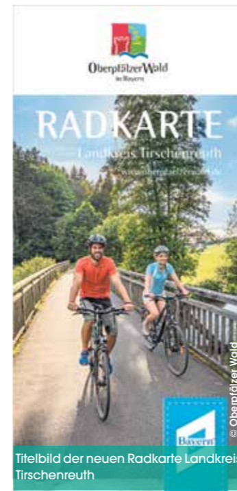
Titelbild der neuen Radkarte Landkreis Tirschenreuth

Diese enthält nicht nur die über 1.000 km beschil- derten Radwege des Land- kreises selbst, sondern zeigt auch Anschlussmöglich- keiten Richtung Neustadt/ WN, Bayreuth, Wunsiedel so- wie nach Tschechien. Fester Bestandteil der Karte sind natürlich Routenbeschrei- bungen für Vizinalbahn- Radweg, Steinwald-Rad- weg & Co. mit Infos zu Länge, Höhenmetern, Sehenswer- tem am Wegesrand und der Wegebeschaffenheit. In der Neuauflage ist zu- dem der Verlauf der Ober- pfälzer Radl-Welt, der neu- en großen Radrunde durch den Oberpfälzer Wald, auf- genommen. Ebenso findet man in der Karte Hinwei- se zur Infrastruktur entlang der Wege, in welchen Or- ten es etwa Einkehr- oder Übernachtungsmöglich- keiten, E-Bike-Ladestationen oder eine Fahrradwerkstatt gibt. Damit ist die gedruckte Radkarte ein wichtiger Bau- stein im Rundum-Sorglos-Pa- ket für Radler des Tourismus-