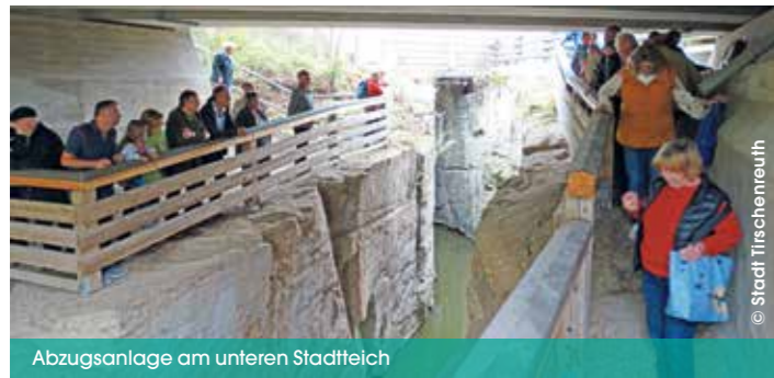
Abzugsanlage am unteren Stadtteich