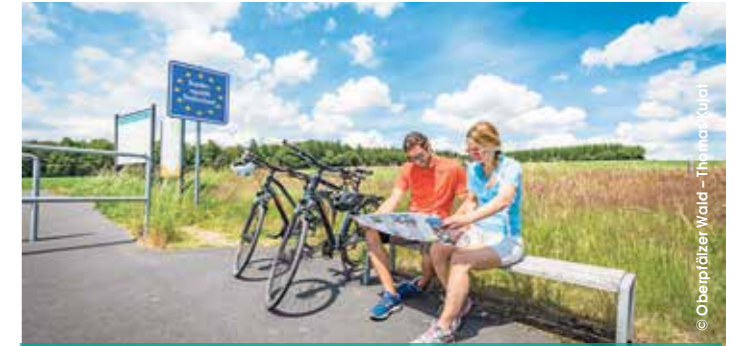
Tourenplanung mit der neuen Radkarte Landkreis Tirschenreuth – hier auf dem Höhen-Radweg am Grenzübergang Hermannsreuth

Den Wind in den Haaren und die Sonne im Gesicht: eine Radtour im Oberpfälzer Wald bietet jede Menge Glücks- momente. Damit Radler ihre nächste Tour ganz bequem planen können und auch un- terwegs immer den Überblick haben, gibt es nun eine neue Radkarte für den Landkreis Tir- schenreuth.