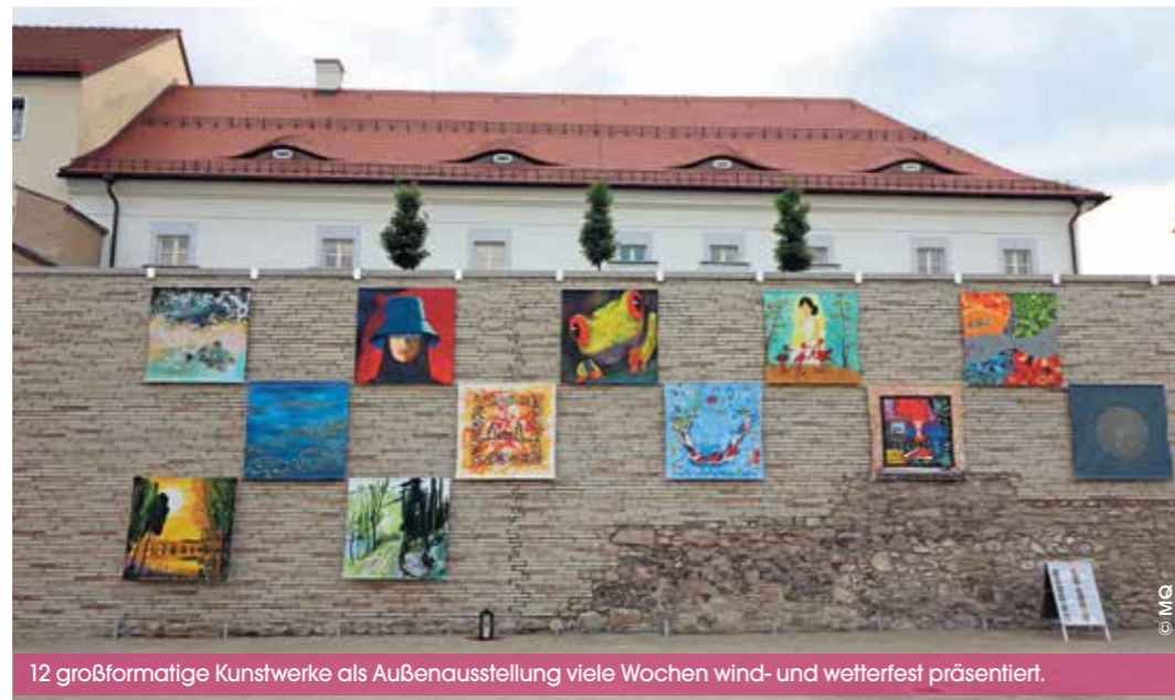
12 großformatige Kunstwerke als Außenausstellung viele Wochen wind- und wetterfest präsentiert.