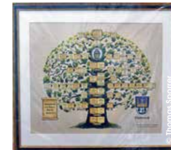
Der gemalte Stammbaum des Johann Andreas Schmeller