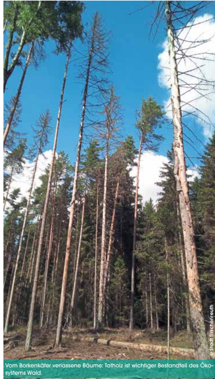
Vom Borkenkäfer verlassene Bäume: Totholz ist wichtiger Bestandteil des Ökosystems Wald.

Einige „Käferbäume“ wurden nicht rechtzeitig entdeckt. So haben es die jungen Käfer geschafft, sich aus den Eiern, die ihre Eltern in der Borke der Bäume abgelegt hatten, zu fertigen Käfern zu entwickeln. Ausgewachsen konnten sie die Bäume verlassen, bevor diese gefällt wurden. Von solchen verlassenen Käferbäumen geht dann kein Risiko mehr aus – dort können keine weiteren Borkenkäfer heranwachsen