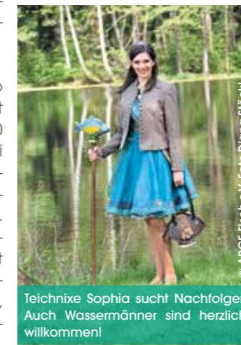
Teichnixe Sophia sucht Nachfolger. Auch Wassermänner sind herzlich willkommen!

Dort ist man nicht nur froh über weibliche Bewerberinnen, auch für einen Wassermann stehen die Türen offen. (Fabian Polster, ARGE Fisch im Landkreis Tirschenreuth e.V. und Fischwirtschaftsgebiet Tirschenreuth)