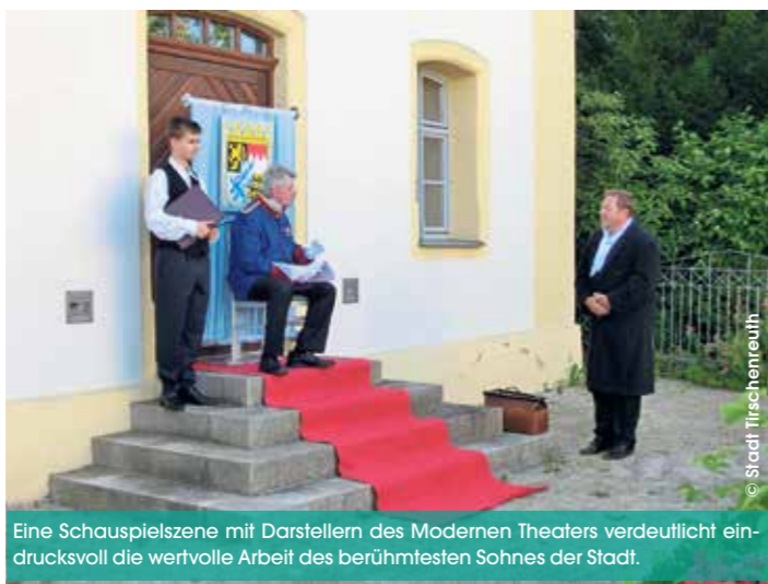
Eine Schauspielerszene mit Darstellern des Modernen Theaters verdeutlicht eindrucksvoll die wertvolle Arbeit des berühmtesten Sohnes der Stadt.