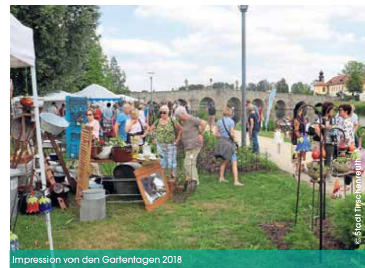
Impression von den Gartentagen 2018

Tradition. Aber auch regionale Unternehmen wie der Maschinenring oder die Ziegler Group präsentieren sich bei den Gartentagen. Für das leibliche Wohl der Besucher sorgen sowohl das Restaurant als auch der Kiosk des Hotels Seenario. „Und wenn sich jemand impfen lassen möchte, hat er bei den Gartentagen beste Gelegenheit dazu. Denn dafür steht an beiden Tagen eine BRK-Impfstation bereit“, informierte Peter Gold. Der sich abschließend sowohl beim BRK als auch bei den Mitgliedern des Fördervereins sowie dem gesamten Gartentage-Organisationsteam für deren Engagement bedankte. Würden doch viele Menschen darauf warten, dass endlich wieder einmal eine Veranstaltung stattfindet. Mehr unter www.fischhofpark-tirschenreuth.de und www.stadt-tirschenreuth.de (Mirko Streich, Förderverein Fischhofpark)