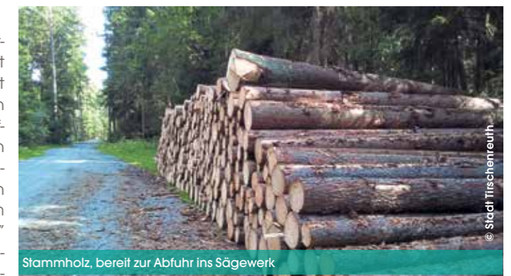
Stammholz, bereit zur Abfuhr ins Sägewerk

Vom Verkaufserlös wird die Holzernte bezahlt, es wird in die Anreicherung des Stadtwaldes mit Mischbaumarten investiert, Waldwege werden gepflegt und Naturschutzmaßnahmen werden finanziert. Was am Ende übrig bleibt, fließt in die Stadtkasse. (Stefan Gradl, Stadtförster)