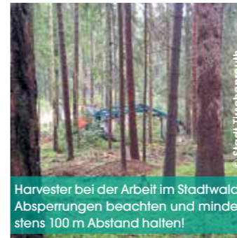
Harvester bei der Arbeit im Stadtwald. Absperrungen beachten und mindestens 100 m Abstand halten!

In jüngster Vergangenheit hat sich das immer wieder schmerzlich bemerkbar gemacht. Mitten im Waldbestand, weit entfernt vom nächsten Weg, tritt Borkenkäferbefall auf. Zehn, zwanzig, dreißig Bäume müssen gefällt werden, aber keine Rückegasse führt dort hin. Um das Holz zum Abtransport an den nächsten Weg bringen zu können, müssen zuerst Gassen angelegt werden. Auf einem Streifen von etwa vier Metern Breite werden dazu alle Bäume entnommen, damit dort Rückemaschinen fahren können. Obwohl Holz, das dabei anfällt, völlig gesund ist, muss es häufig genauso billig verkauft werden wie Käferholz. Das ist schade, liegt aber am Überangebot an Holz, das in ausgeprägten Käferjahren herrscht. „Das will ich zukünftig vermei-