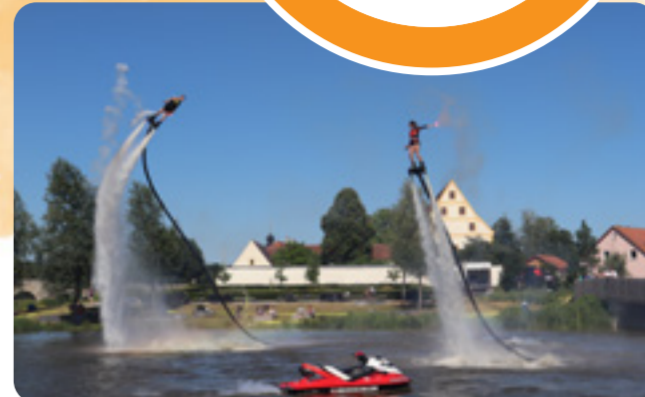
Flyboarder-Show im Sommer

Für adventliche Stimmung sorgt darüber hinaus immer wieder der kunsthandwerkliche Weihnachtsmarkt des Lions-Clubs.