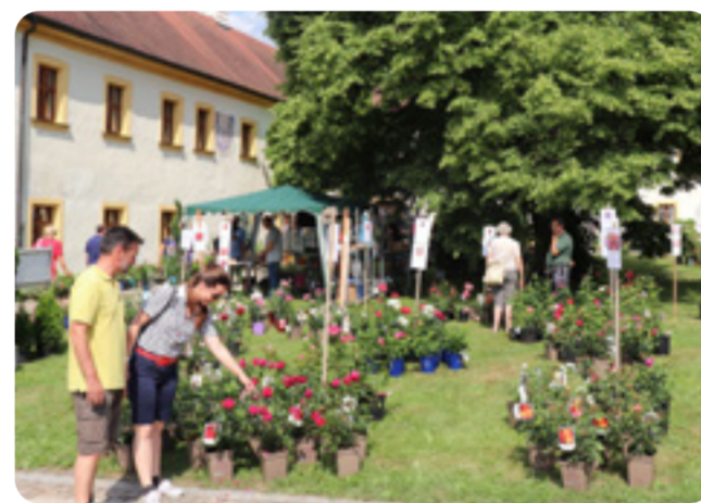
Impression von den Gartentagen