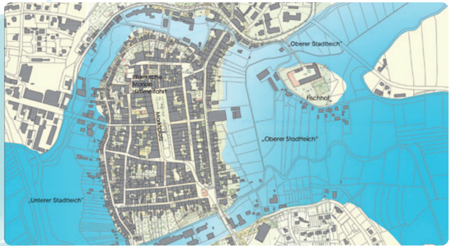
Im Rahmen der Gartenschau 2013 hat man teilweise diese historische Situation wiederhergestellt.